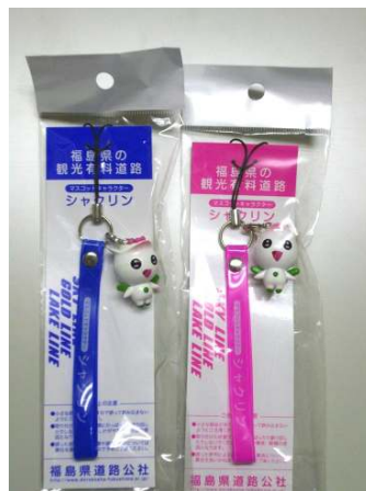
携帯ストラップ(青・ピンク)