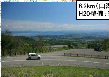
6.2km(山湖台) H20整備: P案内板