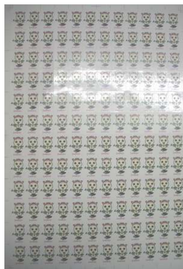
シャクリンシール(封筒用)